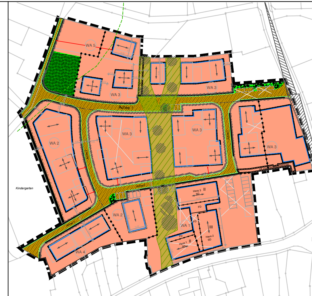
Informelle Übersicht Bebauungsplan "Ortsmitte" vom 03.05.2017 M 1:1.500